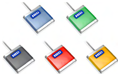
Opcje kolorystyczne / Zestaw akcesoriów